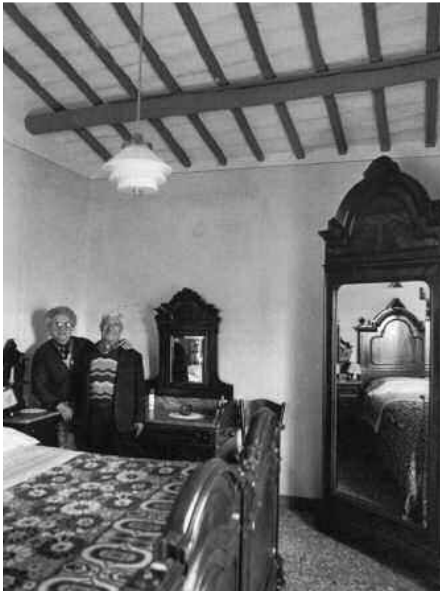
Terni, quartiere S. Agnese, 1989

Alcuni vecchi abitanti hanno, così, deciso di andarsene; al loro posto è arrivato un pezzo di mondo, che alla liberalizzazione del mercato degli affitti risponde aumentando il numero delle tasche disposte a contribuire. Qui circa un terzo degli abitanti proviene da un altro paese e spesso i nomi sui campanelli sono assenti o scritti con improbabili caratteri latini. Non c'è aria di ghettizzazione, perché è assente un retroterra etnico, culturale o sociale, che indichi un confinamento. Spesso le porte delle abitazioni ed i cancelli vengono lasciati aperti, mentre le inferiate alle finestre sono davvero poche; c'è il segno di una qualche forma di fiducia e di presenza costante di persone dentro le abitazioni. Non è un quartiere marginale, qui abitano anche professionisti ed è così piccolo da non poter sviluppare un'economia interna. Sebbene venga attraversato in auto solo da chi intende approfittare del parcheggio gratuito e a piedi dai residenti o da chi abita nelle zone circostanti, non si presenta come un corpo separato dalla città di Terni, della quale raccoglie, invece, una delle caratteristiche più evidenti: la mescolanza sociale, frutto dell'imponente lavoro di livellamento svolto in passato dalla grande industria e dal pubblico impiego, che negli anni ha plasmato un tessuto urbano policentrico ed omogeneo allo stesso tempo.