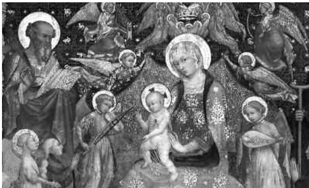
Ottaviano Nulli, Madonna del Belvedere

[...] Voglio ribadire come il mio gesto critico di allora (derivato da oltre un decennio di prove in quella direzione a cominciare da una tesina leopardiana alla Normale del '33) potesse sì sembrare unilaterale, ma non era certo unidimensionale come gli esiti della critica precedente, critica appunto di un Leopardi "a una dimensione". La mia interpretazione ebbe certo la funzione di far pensare per la prima volta a un Leopardi del tutto intransigente ad essere assimilato a pratiche conformate a strutture preesistenti. Essa proponeva invece un Leopardi che le infrangeva vitalmente e fondava un discorso complessivo di più dimensioni, aperto a molte possibilità liberatorie che trascendevano lo statu quo. So che quella lezione ha avuto la sua funzione, a suo modo eroicamente energetica e coerente con se stessa, e che questa sua voce netta e comprensibile a molti in questo minaccioso fin de siècle , può anche risuonare in vista, per la sostanza indiscutibile, storica e metodologica che riesce a trasmettere in tempi di crepuscolo della attività critica, a chi ripropone oggi le "acque di placida laguna" per tendenze di mezzo secolo fa. La falsa disperazione omologata a mode "nere" che si vorrebbe leggere in Leopardi, una sua ineffabilità reclusa in se stessa, rispondono a certe "retoriche di laguna". Certo non meritano che il sorriso di Eleandro [...]